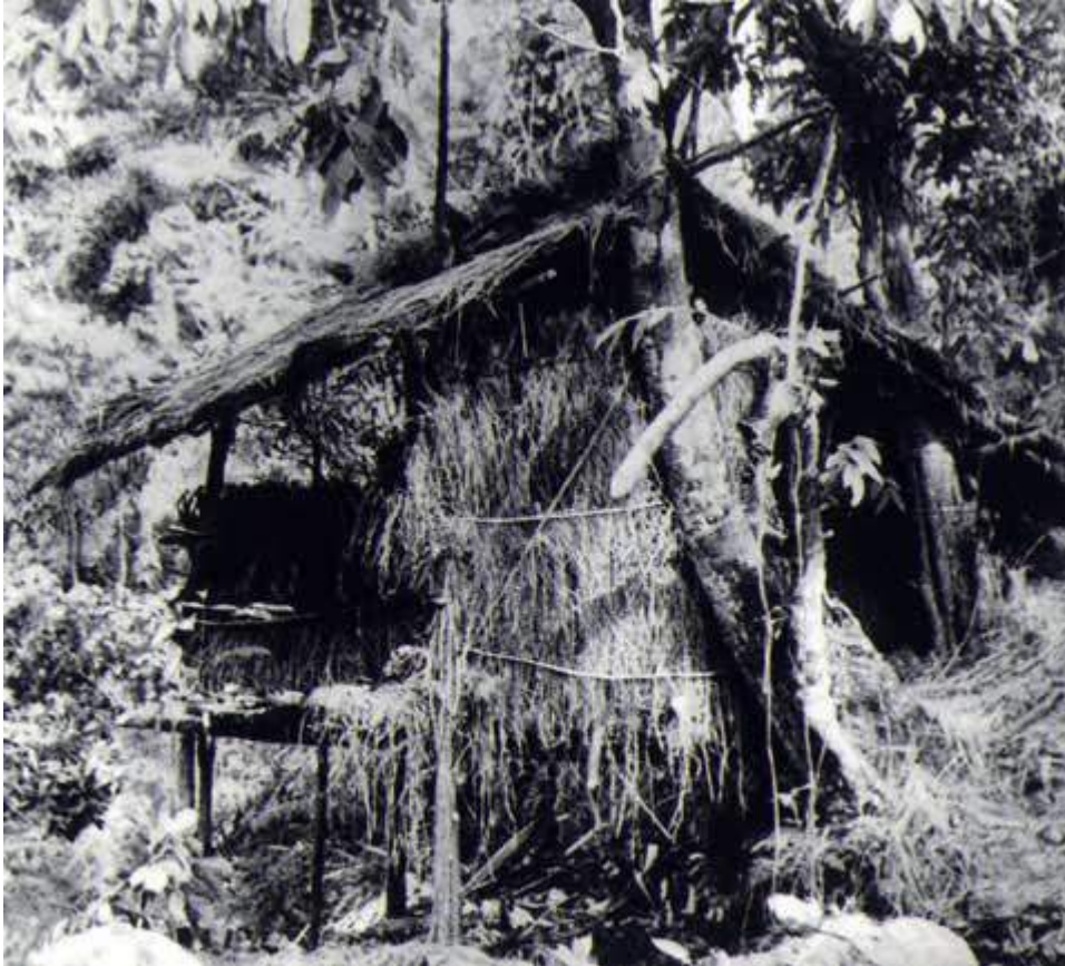
Lán Khuổi Nậm ở Pác Bó, xã Trường Hà, huyện Hà Quảng, Cao Bằng, nơi diễn ra Hội nghị Trung ương Đảng cộng sản Đông dương lần thứ VIII (5/1941) quyết định thành lập Mặt trận Việt Minh.

Để thực hiện mục tiêu đó, Hội nghị đã quyết định thành lập Việt Nam độc lập đồng minh (gọi tắt là Việt Minh) nhằm tập hợp và đoàn kết rộng rãi các giai cấp, các dân tộc, tôn giáo, các giới... tham gia Mặt trận.