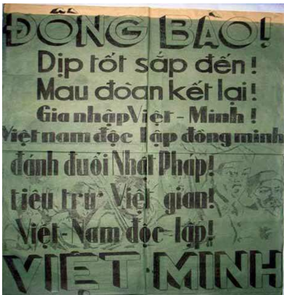
Khẩu hiệu của Việt Minh kêu gọi đồng bào gia nhập Việt Minh và đoàn kết đánh đuổi Nhật - Pháp.

Mặt trận Việt Minh lấy lá cờ đỏ có ngôi sao vàng năm cánh làm huy hiệu, khẩu hiệu chính là: phản Pháp - kháng Nhật - liên hoa - độc lập.