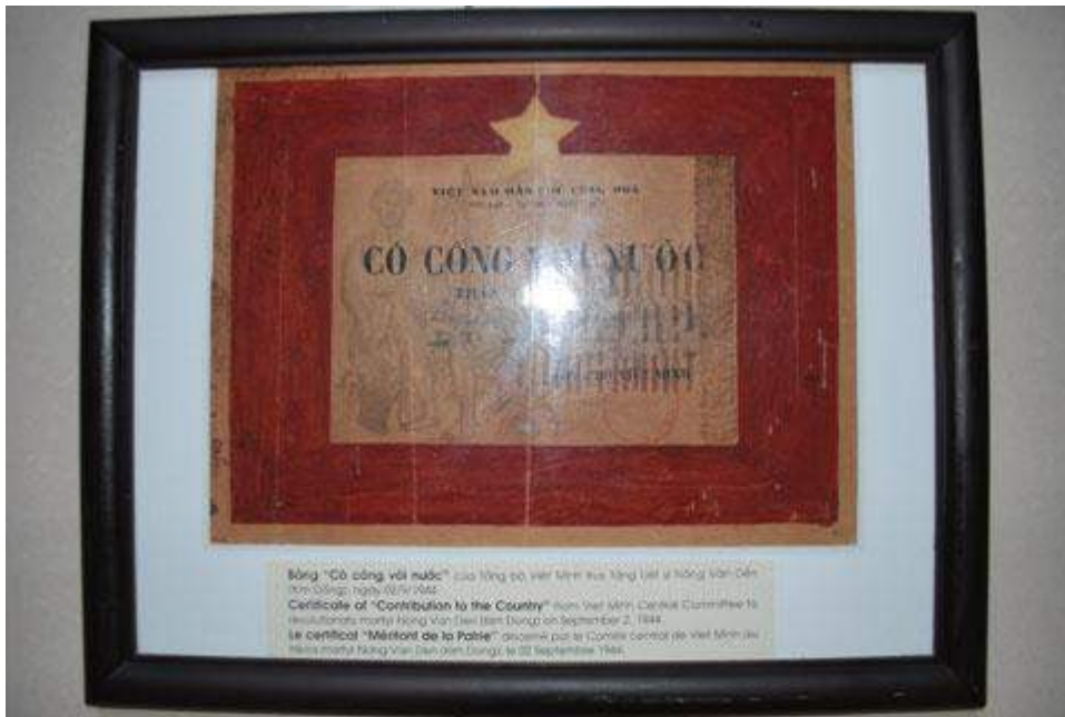
Bằng “Có công với nước” của Tổng bộ Việt Minh truy tặng Liệt sĩ Nông Văn Dền-Kim Đồng ngày 2/9/1944.

trào lập tức được các tập thể Đội và đội viên khắp mọi miền hưởng ứng. Ngày 15-5-1986, nhân kỷ niệm lần thứ 45 Ngày thành lập Đội TNTP Hồ Chí Minh, Khu di tích lịch sử Kim Đồng với ngôi mộ Anh và tượng đài người Liệt sỹ Anh hùng Kim Đồng đang tung con chim sáo bay lên đã được khánh thành. Từ đó đến nay, khu di tích trở thành một địa chỉ đỏ chào đón các thế hệ thiếu nhi Việt Nam về với nơi khởi nguồn cho truyền thống vẻ vang của Đội ta.