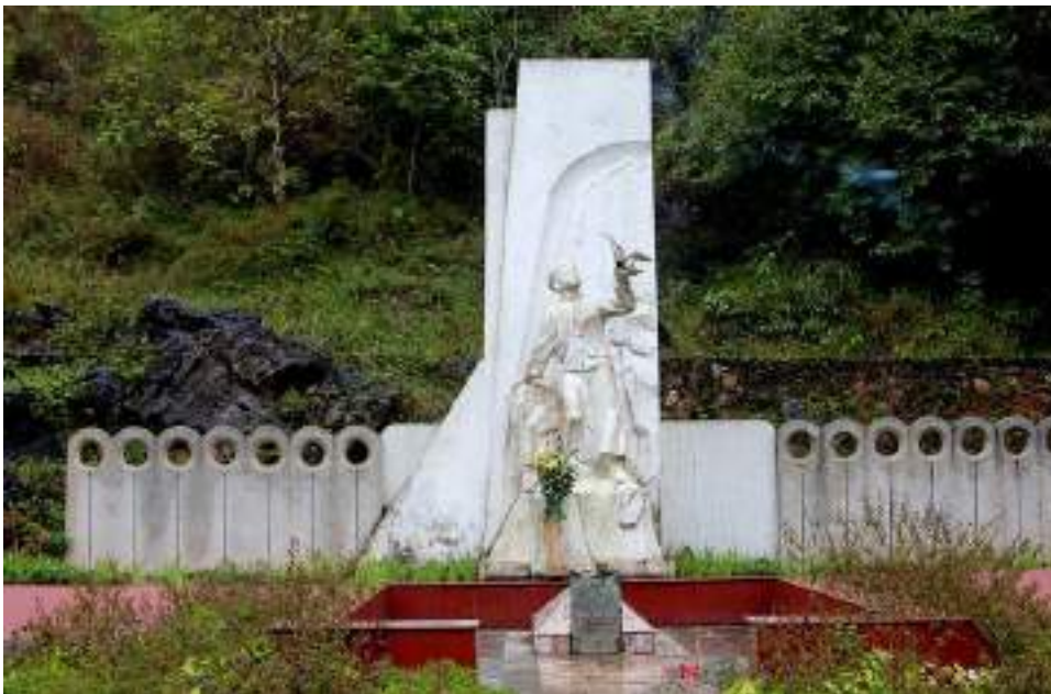
Mộ Anh hùng liệt sĩ Nông Văn Dền - Kim Đồng (1929-1943) tại bản Nà Mạ, xã Trường Hà, huyện Hà Quảng, Cao Bằng.

Bước sang năm 1943, bọn địch khủng bố, đánh phá dữ dội vùng Pắc Bó (Cao Bằng), trong lúc đang làm nhiệm vụ canh gác cuộc họp của Việt Minh, khi phát hiện giặc lùng sục đến gần, Kim Đồng đã nhanh trí đánh lạc hướng để bảo vệ cán bộ cách mạng, địch nổ súng, Kim Đồng bị trúng đạn và đã hy sinh, khi đó vừa tròn 14 tuổi.