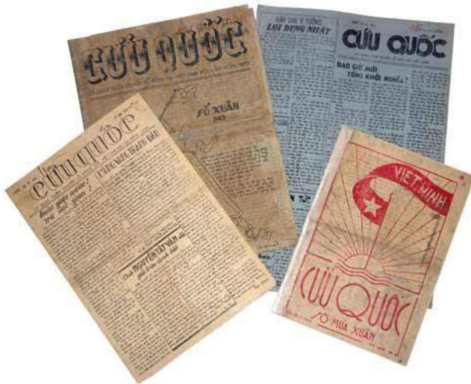
Báo Cứu quốc, cơ quan của Tổng bộ Việt Minh ra đời 2/1942.

Tại khu Việt Bắc, chính quyền địch ở cơ sở bị tê liệt, quần chúng bắt đầu làm chủ thôn xóm ở mức độ nhất định. Việt Minh là người đại diện quyền làm chủ của quần chúng, trực tiếp giải quyết mọi công việc của thôn xóm.