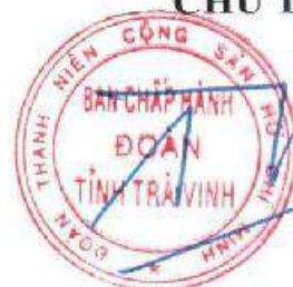
Trần Trí Cường