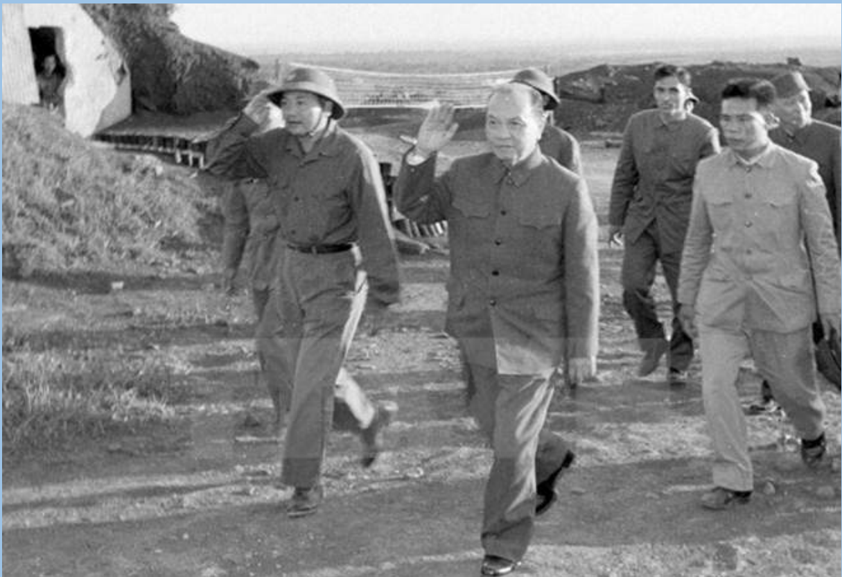
Cuộc đời và sự nghiệp của đồng chí Trường Chinh

Đồng chí Trường Chinh tên thật là Đặng Xuân Khu, sinh ngày 09/2/1907 ở làng Hành Thiện, xã Xuân Hồng, huyện Xuân Trường, tỉnh Nam Định. Mất ngày 30/9/1988 tại Hà Nội. Sinh ra trong một gia đình trí thức yêu nước ở một vùng quê giàu truyền thống lịch sử và văn hoá, truyền thống của quê hương và gia đình đã bồi đắp và hun đúc nên lý tưởng cách mạng của đồng chí. Sau khi tìm hiểu “Đường Kách mệnh” và các tác phẩm khác của Nguyễn Ái Quốc, đồng chí đã đến với chủ nghĩa Mác - Lê-nin; từ một người yêu nước, đồng chí trở thành người cộng sản.