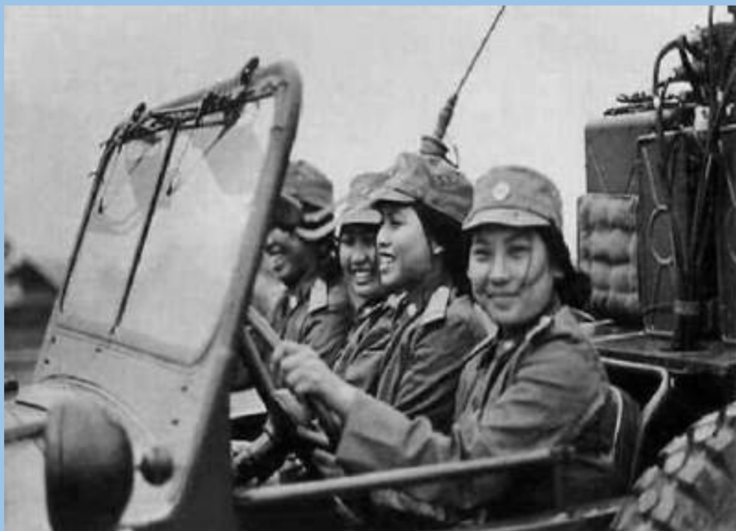
Bảo vệ biên giới phía Bắc một chương lịch sử sáng chói của dân tộc