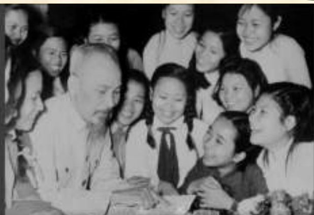
Trong ảnh: Địch viên Hồ Chí Minh (trung) cùng học Trường Vương (Hà Nội) đến chúc mừng sinh nhật Chủ tịch Hồ Chí Minh (19/5/1952).