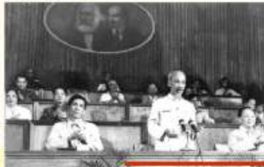
Đại hội toàn quốc lần thứ III của Đảng năm 1960