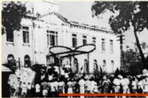
Nhân dân Hà Nội đánh chiếm Bộ Phủ, giành chính quyền về tay nhân dân, ngày 19/8/1945

Tháng 8/1945, Hồ Chí Minh cùng Trung ương Đảng lãnh đạo nhân dân khởi nghĩa giành chính quyền thắng lợi.