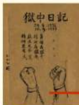
Bản gốc Ngục trung nhật ký (Nhật ký trong tù)

Tháng 8/1942, lấy tên là Hồ Chí Minh, Người đại diện cho Mặt trận Việt Minh và Phân hội Việt Nam thuộc Hiệp hội Quốc tế chống xâm lược sang Trung Quốc bất liên lạc với Đông minh, cùng phối hợp hành động chống phát xít trên chiến trường Thái Bình Dương. Người bị chính quyền địa phương của Tưởng Giới Thạch bắt giam trong các nhà lao của tỉnh Quảng Tây (Trung Quốc). Trong thời gian bị giam giữ, Người viết cuốn Nhật ký trong tù.