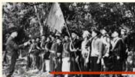
Lễ xuất phát của Đội Việt Nam giải phóng quân do Đại tướng Võ Nguyên Giáp chỉ huy ngày 16/8/1945 tại Tân Trào