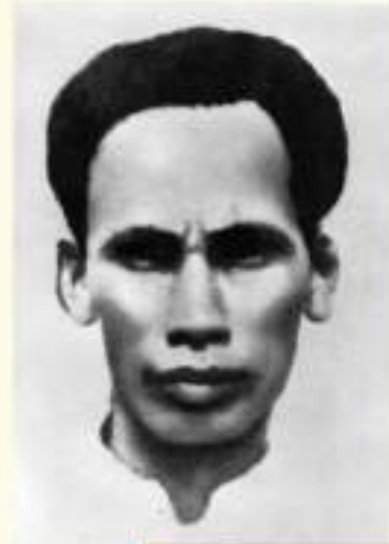
Đổng chí Nguyễn Ái Quốc năm 1930