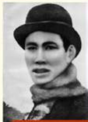
Nhà cách mạng Nguyễn Ái Quốc năm 30 tuổi, khi ở Pháp