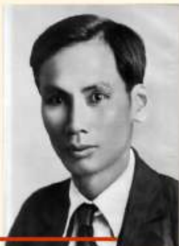
Nguyễn Ái Quốc ở Liên Xô năm 1923