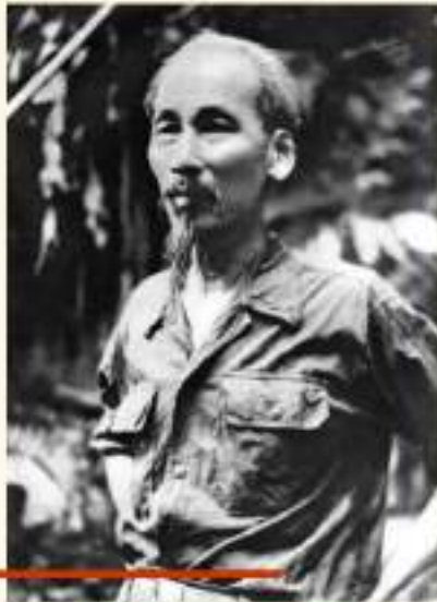
Chủ tịch Hồ Chí Minh sau ngày toàn quốc chiến thắng thực dân Pháp năm 1954