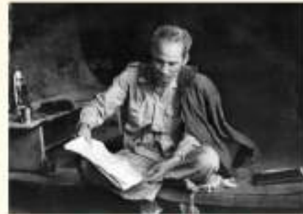
Chủ tịch Hồ Chí Minh làm việc tại hang đá Việt Bắc năm 1951