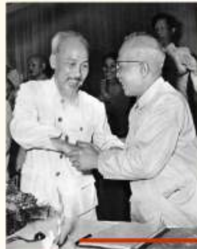
Chủ tịch Hồ Chí Minh chúc mừng cụ Tân Đức Thắng được Quốc hội khoá 2 bầu làm Phó Chủ tịch nước Việt Nam Dân chủ cộng hoà tháng 7/1960