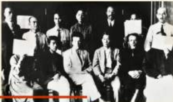
Năm 1935, Hồ Chí Minh tham dự Đại hội Quốc tế Cộng sản lần thứ XII tại Liên bang Nga