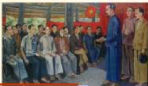
Tranh vẽ Chủ tịch Hồ Chí Minh tại hội nghị quyết định Tổng khởi nghĩa năm 1945