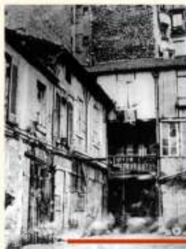
Ngôi nhà số 9, ngõ Công Poanh (Compoint), nơi ở của Nguyễn Ái Quốc từ năm 1921 - 1923