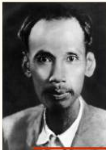
Chủ tịch Hồ Chí Minh năm 1945