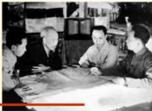
Ngày 06/12/1953, tại Việt Bắc, Chủ tịch Hồ Chí Minh và các đồng chí trong Ban Thường vụ Trung ương Đảng hợp quyết định mở Chiến dịch Điện Biên Phủ, thúc đẩy thực dân Pháp xâm lược