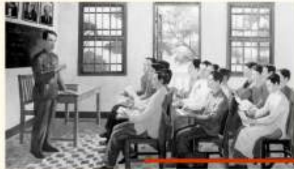
Lớp tập huấn cán bộ cách mạng Việt Nam tại Quảng Châu (Trung Quốc) do Nguyễn Ái Quốc tổ chức nhằm chuẩn bị tiến tới thành lập Đảng Cộng sản Việt Nam.

Tháng 11/1924, Nguyễn Ái Quốc rời Liên Xô về Quảng Châu (Trung Quốc). Tháng 6/1925, Người thành lập Hội Việt Nam cách mạng thanh niên, trực tiếp mở các lớp huấn luyện cán bộ, ra Báo Thanh niên (1925), tờ báo cách mạng đầu tiên của Việt Nam nhằm truyền bá chủ nghĩa Mác - Lênin về Việt Nam, chuẩn bị cho việc thành lập Đảng Cộng sản Việt Nam. Các bài giảng của Nguyễn Ái Quốc được tập hợp và in thành tác phẩm Đường Cách mệnh, được xuất bản vào năm 1927.