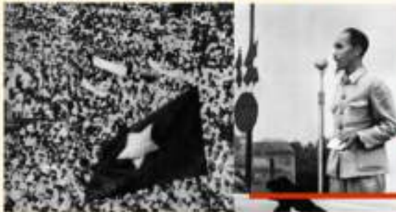
Tháng 2/1946, Người nói chuyện với hơn 10 vạn Nhân dân Thủ đô Hà Nội sau cuộc tổng tuyển cử bầu ra Quốc hội đầu tiên của nước Việt Nam Dân chủ Cộng hòa