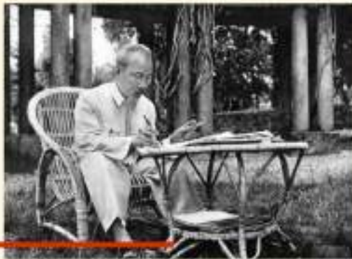
Chủ tịch Hồ Chí Minh ngồi làm việc tại Phủ Chủ tịch