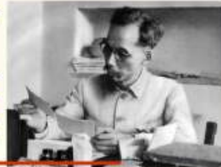
Chủ tịch Hồ Chí Minh trong phòng làm việc của Người ở Phủ Chủ tịch năm 1946