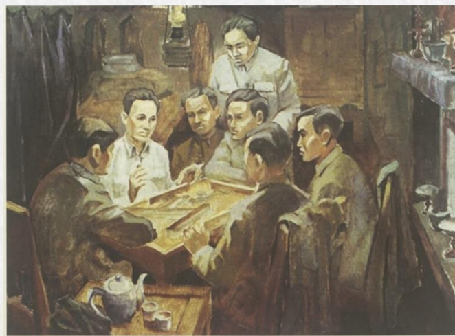
Hội nghị thành lập Đảng Cộng sản Việt Nam ở Hồng Kông do đồng chí Nguyễn Ái Quốc chủ trì mùa Xuân năm 1930 (Ảnh chụp tranh của họa sĩ Phan Kế An)

Đại biểu các tổ chức cộng sản Đông Dương tham dự Hội nghị thành lập Đảng Cộng sản Việt Nam ở Hồng Kông mùa Xuân năm 1930 do đồng chí Nguyễn Ái Quốc chủ trì