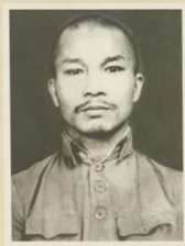
Đồng chí Lê Hồng Sơn