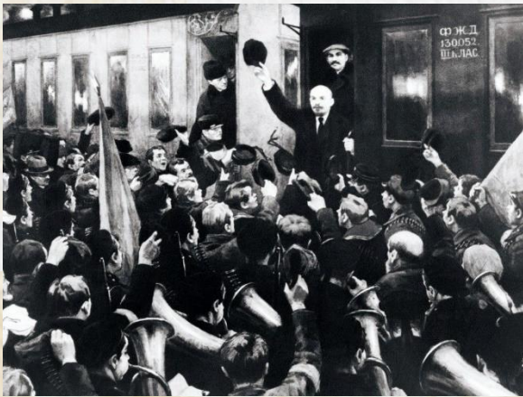
Hàng vạn quần chúng đã tổ chức tuần hành, mít tinh để chào đón V.I. Lê-nin, người con ưu tú của nước Nga tại nhà ga ở thành phố Petrograd

Ngày 16-4-1917, V.I. Lê-nin đến Petrograd để trình bày bản Luận cương Tháng Tư nổi tiếng, thực chất đây là một văn kiện mang tính cương lĩnh đề ra đường lối giành chiến thắng cho cuộc cách mạng xã hội chủ nghĩa với khẩu hiệu: "Toàn bộ chính quyền về tay các Xô Viết!". Hội nghị lần thứ VII toàn Nga (tháng 4-1917) của Đảng Công nhân xã hội dân chủ Nga đã nhất trí thông qua đường lối cách mạng do V.I. Lê-nin đề ra.