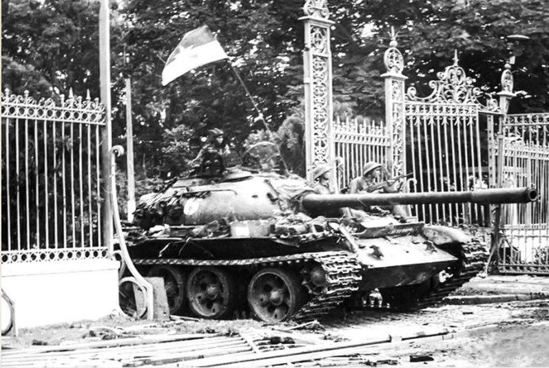
Xe tăng tiến vào Dinh Độc Lập ngày 30/4/1975. Ảnh tư liệu

Cách đây 49 năm, cuộc tổng tiến công và nổi dậy mùa xuân năm 1975 mà đỉnh cao là chiến dịch Hồ Chí Minh lịch sử đã giành thắng lợi hoàn toàn. Ngày 30 tháng 4 năm 1975 đã đi vào lịch sử dân tộc như một mốc son chói lọi đưa đất nước ta bước vào một kỷ nguyên mới, kỷ nguyên độc lập dân tộc và chủ nghĩa xã hội. Toàn Đảng, toàn dân, toàn quân ta từ đây tập trung sức lực và trí tuệ hàn gắn vết thương chiến tranh xây dựng cuộc sống mới; xây dựng và bảo vệ Tổ quốc Việt Nam xã hội chủ nghĩa.