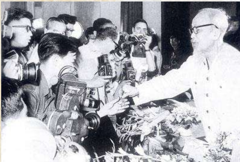
Bác Hồ với các phóng viên báo chí

Thời gian này, với cương vị Ủy viên Bộ Phương Đông, trực tiếp phụ trách Cục Phương Nam, là một nhà yêu nước có sự hiểu biết sâu sắc văn hóa Đông - Tây, là nhà cách mạng, thâm nhuần chủ nghĩa Mác Lênin, một người từng nhiều năm làm báo và hiểu rõ sức mạnh của báo chí, Nguyễn Ái Quốc rất tâm đắc những quan điểm của Lê nin về báo chí: “Trong thời đại ngày nay, không có tờ báo chính trị thì không thể có phong trào gọi là chính trị”, “chúng ta cần trước hết là tờ báo, không có nó thì không thể tiến hành một cách có hệ thống cuộc tuyên truyền, cổ động hết sức có nguyên tắc và toàn diện”[1]. “Báo chí là người tuyên truyền, người cổ động, người tổ chức chung, người lãnh đạo chung” [2].