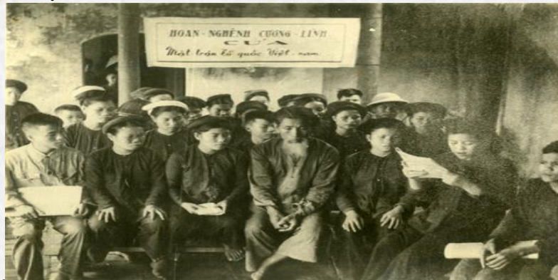
Nhân dân miền Bắc nghe đọc cương lĩnh của Mặt trận Tổ quốc Việt Nam, tháng 09/1955

Sau năm 1954, đế quốc Mỹ và bè lũ tay sai phá hoại Hiệp định Giơ-ne-vơ chiếm đóng miền Nam, chia cắt lâu dài nước ta. Cách mạng Việt Nam lúc này có hai nhiệm vụ chiến lược là tiến hành cách mạng xã hội chủ nghĩa ở miền Bắc và hoàn thành cách mạng dân tộc dân chủ ở miền Nam, thực hiện thống nhất nước nhà. Trong bối cảnh đó, ngày 10/9/1955 Đại hội Mặt trận Dân tộc thống nhất họp tại Hà Nội đã quyết định thành lập Mặt trận Tổ quốc Việt Nam và thông qua Cương lĩnh nhằm đoàn kết mọi lực lượng dân tộc, dân chủ và hòa bình trong cả nước để đấu tranh chống đế quốc Mỹ và bè lũ tay sai, xây dựng một nước Việt Nam hòa bình, thống nhất, độc lập, dân chủ và giàu mạnh.